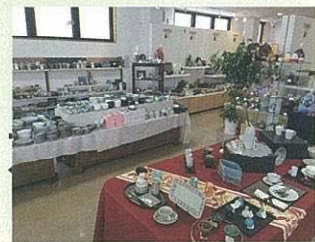
陶磁器会館 会津本郷焼直売所