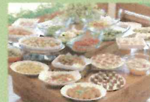
いわたて 1F 会津本郷直売所 2F 野菜ビュッフェレストラン