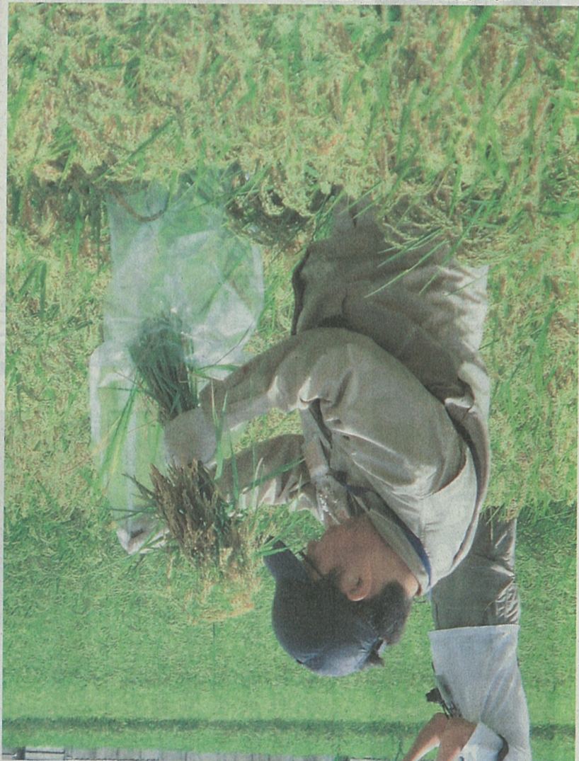
サンプリング採取のため作業をする県の担当者。5日、棚倉町

【福井県】福井県は、東日本大震災発生から1年、水産物や農産物の放射性物質検査が本格化している。県は、放射性物質検査の徹底を図るため、今年10月1日から、県内全産地において、水産物や農産物の放射性物質検査を本格化させる。放射性物質検査の徹底を図るため、今年10月1日から、県内全産地において、水産物や農産物の放射性物質検査を本格化させる。